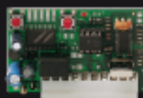
900RXI-41 Récepteur radio à 1 canal, code fixe 1 Kanal, fix Code Radio Empfänger