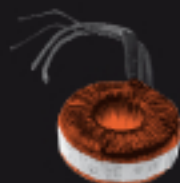
900TRASTORCT2 Transformateur toroïd Ringtransformator