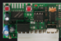
900RXI-42 Récepteur radio à 2 canaux, code fixe 2 Kanäle, fix Code Radio Empfänger.