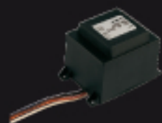
900TRAS80 Transformateur Transformator