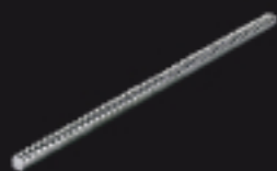
900CREM-30 Crémaillère M6 en fer 30x30 MM L=1000 MM M6 eisen zahnraste 30x30 MM L=1000 MM