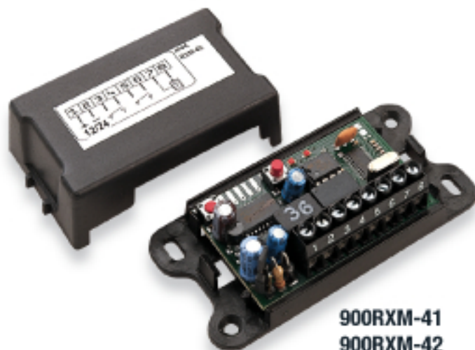
900RXM-41 900RXM-42 900RXM-41R 900RXM-42R