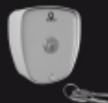
900SEL-M Sélecteur à clé métallique pour utilisation extérieure Metalaußenwähler