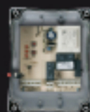
900CT-SWEXT Centrale moteurs pour store in box Motorsteuerung für rolläden in box