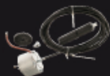
900SW-EF Electro-frein avec déblocage Elektrobremsse mit Aufsperrung