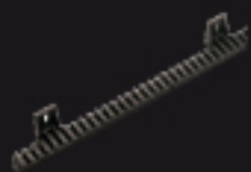
900CREM-P Crémaillère M4 en nylon L=1000 MM M4 Nylon-Zahnstange, L=1000 MM