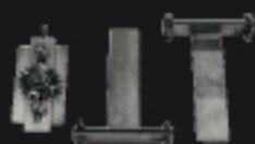
900RT Renvoi tendeur de chaîne étrier Kettenspanner mit Spannbügel