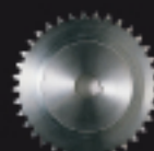
900CRZ36 Couronne 36 dents Kronrad 36 zähne