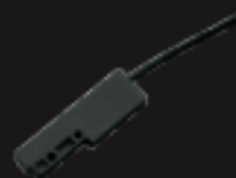
900FIMA Fin de course magnétique Magnetischer Endschalter