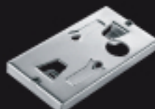
900CPSC-50 Plaque de fixation Befestigungsplatte