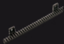
900CREM-P Crémaillère M4 en nylon L=1000 MM M4 Nylon-Zahnstange, L=1000 MM