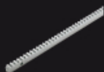
900CREM-8 Crémaillère M4 en fer 30x8 MM L=1000 MM M4 Eisen-Zahnstange 30x8 MM, L= 1000MM